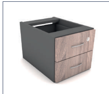
GAVETEIRO FIXO 02 GAVETAS

Caixa e frentes 15mm Puxador de plástico ou Caixa e frentes 18mm Puxador em aço escovado (P 370 x A 140) (P 370 x A 156) Largura consulte a tabela