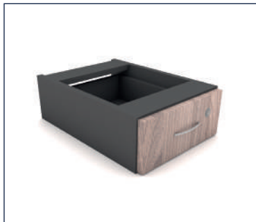
GAVETEIRO FIXO 01 GAVETA

Caixa e frentes 15mm Puxador de plástico ou Caixa e frentes 18mm Puxador em aço escovado (P 370 x A 140) (P 370 x A 156) Largura consulte a tabela