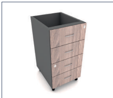
GAVETEIRO PEDESTAL COMPARTILHADO COM 04 GAVETAS

Caixa e frentes 15mm Puxador de plástico ou Caixa e frentes 18mm Puxador em aço escovado (P 370 x A 327) (P 370 x A 340) Largura consulte a tabela