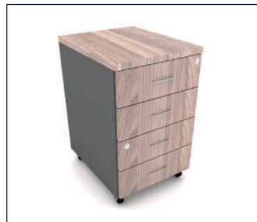
GAVETEIRO VOLANTE COMPARTILHADO COM 04 GAVETAS

Com corrediça metálica Puxador em aço escovado. (P 370 x A 725) Largura consulte a tabela