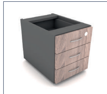
GAVETEIRO FIXO 03 GAVETAS

Caixa e frentes 15mm Puxador de plástico ou Caixa e frentes 18mm Puxador em aço escovado (P 370 x A 260) (P 370 x A 290) Largura consulte a tabela